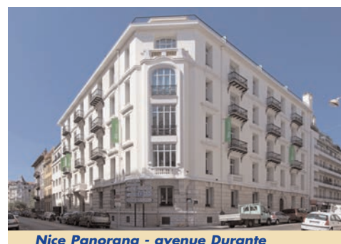
Nice Panorana - avenue Durante