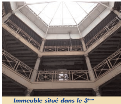
Immeuble situé dans le 3 ème

D'une manière générale, nous privilégions des sites à taille humaine dont les services participeront à près de 50 % du chiffre d'affaires.