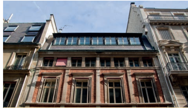
Paris 16 - rue Leroux

De son côté, Novaxia Asset Management a pour mission de lever des capitaux. Depuis l'origine, plus de 100 M€ ont été collectés auprès de 3 000 investisseurs : particuliers, banques privées, family offices et plus récemment, institutionnels, une clientèle que nous sommes en train d'élargir. Cette force de frappe, constituée de fonds dédiés, permet d'avoir un portefeuille d'une trentaine de projets à Paris et à Nice. Nous détenons les actifs entre deux et cinq ans avant de les céder.