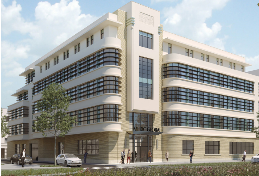
Pôle pluridisciplinaire de santé à Chessy-Val-d'Europe

T. Scheur : Il résulte de la conjugaison de deux forces tectoniques. D'une part, la montée en puissance du Private Equity, tendance qui n'est pas toujours forcément exprimée, mais qui se développe jusque dans les contrats-vie de certains assureurs ! D'autre part, l'appétence des assureurs pour trouver des solutions plus liquides, plus visibles que les Scpi dans l'escarcelle de leurs fonds