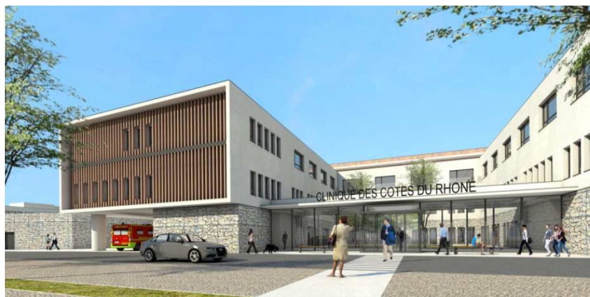
Clinique des Côtes du Rhône

Avec Trajectoire Santé, nous proposons aux exploitants d'explorer cette troisième voie,