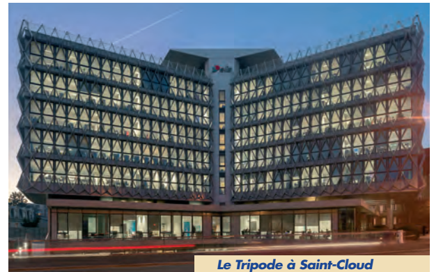
Le Tripode à Saint-Cloud

A. Delaporte : Si l'activité tertiaire reste, pour l'instant, dominante avec la commercialisation de l'Académie à Montrouge et la consolidation des autres projets en cours, nous allons continuer le développement du résidentiel. Majoritairement en Ile-de-France, nous continuerons égale-