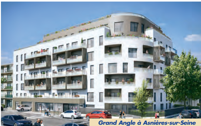
Grand Angle à Asnières-sur-Seine