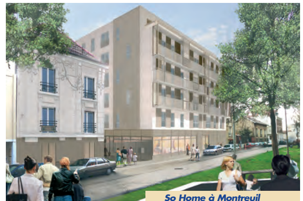
So Home à Montreuil

ment à accompagner nos clients, au fil des opportunités, sur l'ensemble des grandes métropoles.