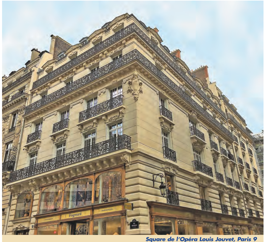
Square de l'Opéra Louis Jouvet, Paris 9

La compensation correspond au local qui sera transformé en habitation en lieu et place de la surface transformée en bureaux. Celle-ci doit prendre forme dans un périmètre géographique bien défini. La mutation vers un usage autre que l'habitation n'est possible que si cette modification est compensée par la création d'un autre espace dédié au logement selon certaines conditions. Seule une compensation réelle en nature