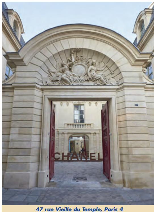
47 rue Vieille du Temple, Paris 4

Il s'avère que l'occupation de nombreuses surfaces de bureaux parisiens n'est pas conforme à la destination définie par la qualification administrative. Notre expérience nous a montré que plusieurs milliers de m 2 sont ainsi en attente de régularisation dans les 8 e et 9 e arrondissements, d'où une inflation du montant des prix des cessions comme le montre le tableau en page 4. Un bail peut, ainsi, se révéler nul et être dénoncé par un locataire qui y trouverait intérêt ! La responsabilité du bailleur est, en effet, engagée dans le cas d'une activité inadaptée, pour partie ou en totalité, au caractère juridique du bien. En cas d'infraction constatée et caractérisée par l'Administration, le risque d'une condamnation pénale n'est pas négligeable. Or, des informations aisément accessibles sur internet ou dans le voisinage facilitent souvent la tâche des autorités municipales pour appréhender