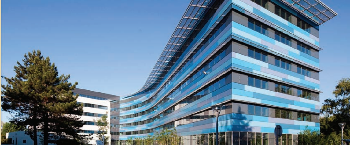
Vélizy, Topaze, 14 000 m 2 de bureaux