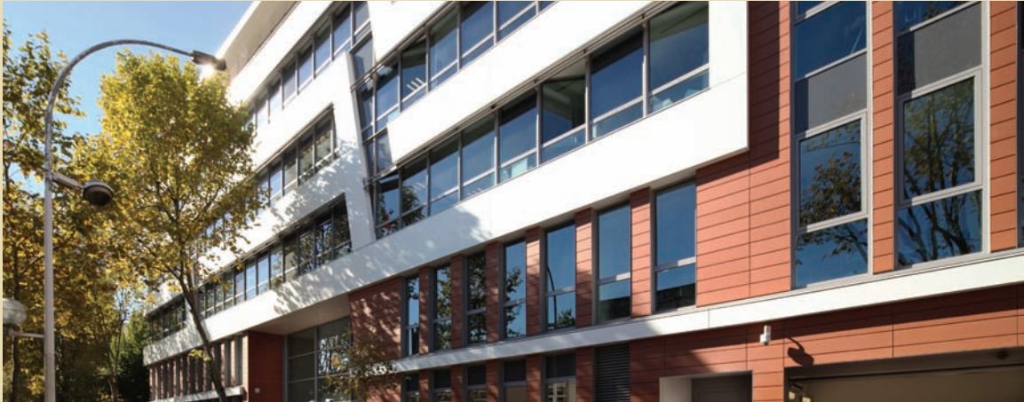
Montrouge, 5 200 m 2 de bureaux