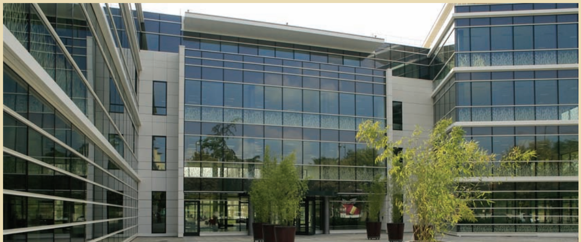
Rueil Malmaison, City Zen 6 829 m 2

de se désendetter. Les arbitrages ont ciblé, pour l'essentiel, les actifs de province. Ce processus réussi a permis de réduire, sur les deux dernières années, le ratio d'endettement LTV de 60 % à 46 %. Simultanément, le groupe s'est recentré sur des actifs de bureaux sécurisés en première couronne de la région parisienne. En septembre 2014, après une reprise des acquisitions pour environ 104 M€, le patrimoine de STE représente 370 000 m 2 , composé à hauteur de 92 % de bureaux et situé à 75 % en région parisienne. La valeur du portefeuille est proche de 800 M€. Son taux d'occupation s'élève à 91 %. A partir de ce socle solide, nous allons poursuivre notre développement en région parisienne.