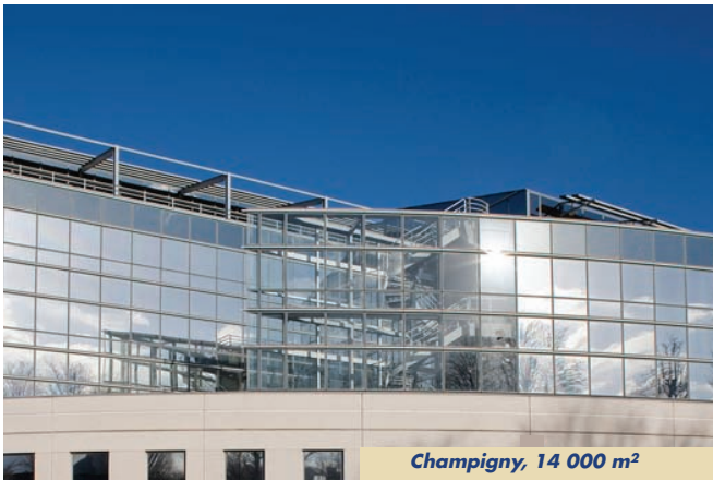
Champigny, 14 000 m 2