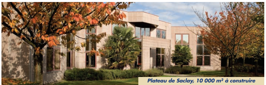
Plateau de Saclay, 10 000 m 2 à construire

Ph. Lemoine : La STE réunit une vingtaine de professionnels très expérimentés. Ils ont pu démontrer leur savoir-faire