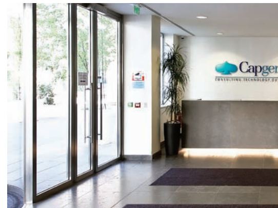
Suresnes, 14 800 m 2 acquisition 2014

Bruno Meyer : Après une phase de restructuration menée par la direction précédente, STE a d'ores et déjà renoué avec une phase de croissance et se tient prête