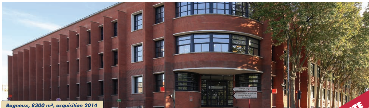
Bagneux, 8300 m 2 , acquisition 2014

son management a développé un patrimoine de qualité de bureaux-activités en Ile-de-France et en province. Pour ce faire, une politique dynamique de levée de fonds auprès des établissements financiers a été mise en œuvre. La crise de 2008 a frappé de plein fouet cette stratégie. De fait, la jeune foncière a dû engager une politique résolue de cessions afin ●●●