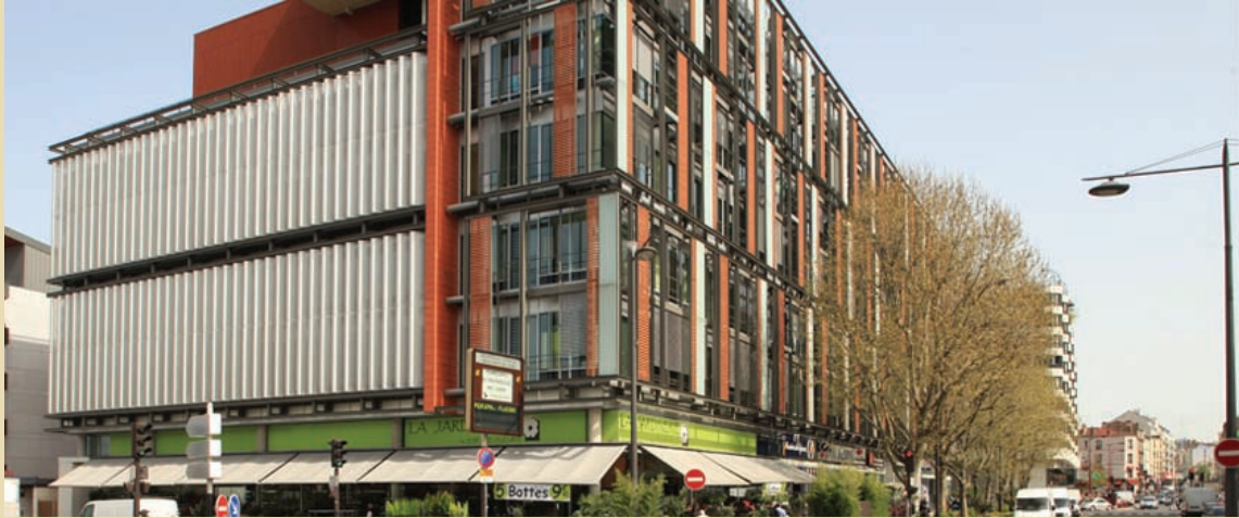
Porte des Lilas, Domino, 13 000 m 2