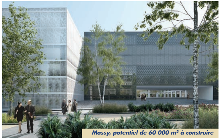
Massy, potentiel de 60 000 m 2 à construire