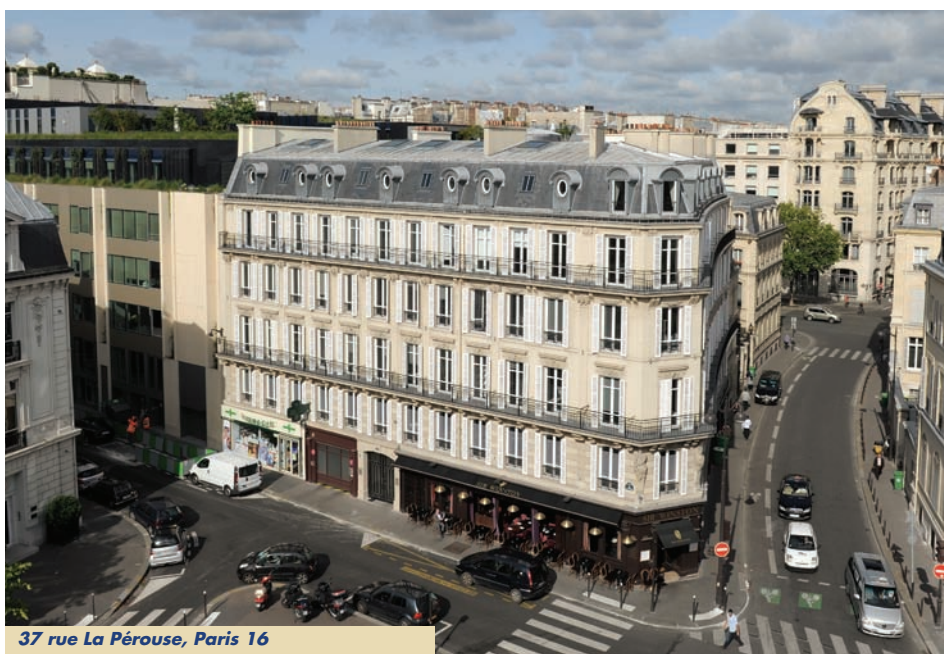
37 rue La Pérouse, Paris 16

Notre entité apparaît comme une proposition originale sur le marché, forte d'une expérience et d'une maîtrise des métiers de l'immobilier. Vision globale, réactivité, concentration des compétences et proximité partenariale avec les différents acteurs s'avèrent de sérieux atouts sur l'ensemble de la chaîne de création de valeur. Les