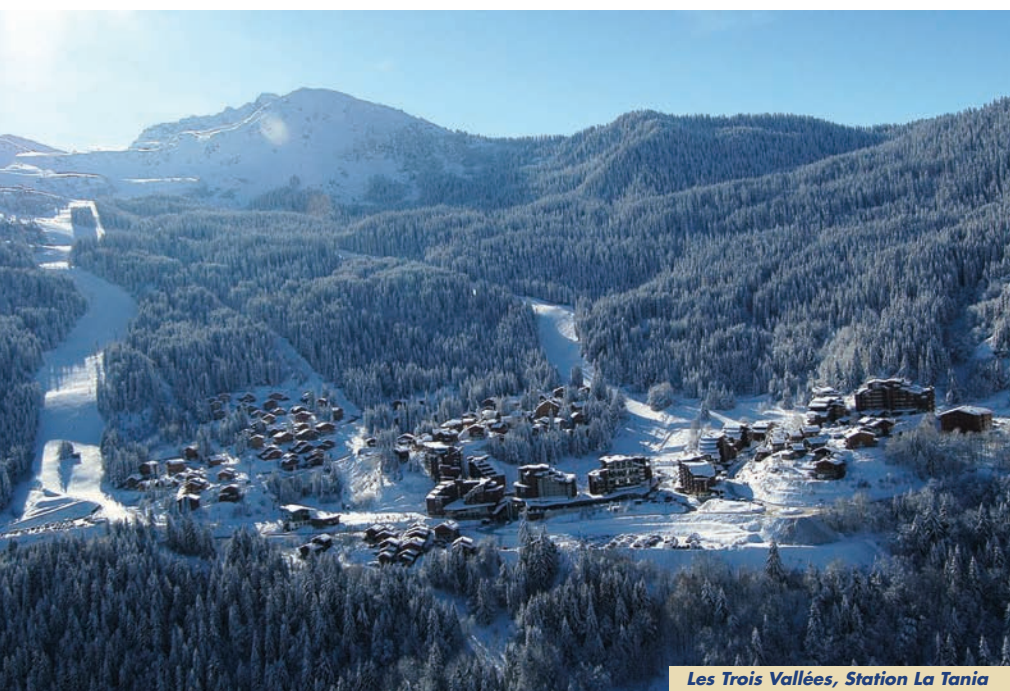
Les Trois Vallées, Station La Tania

risques, qui sont également renforcés par la capacité de nos différents services à travailler main dans la main pour bénéficier au mieux de nos complémentarités.