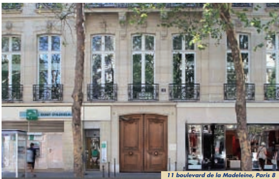
11 boulevard de la Madeleine, Paris 8