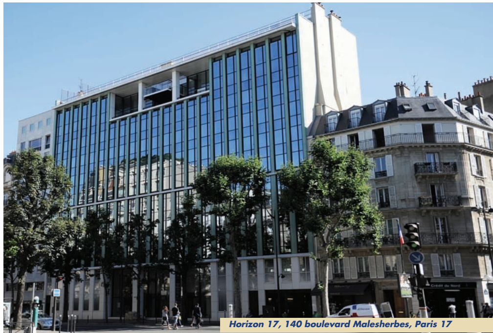
Horizon 17, 140 boulevard Malesherbes, Paris 17