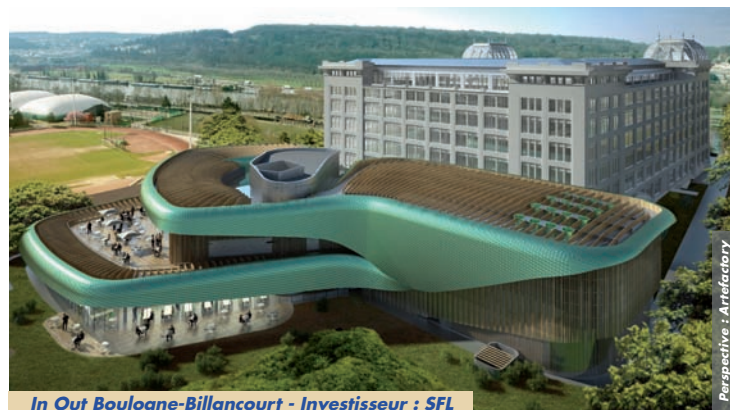
In Out Boulogne-Billancourt - Investisseur : SFL

Fort de ce savoir-faire, nous sommes consultés aujourd'hui sur des îlots parisiens, des sites du Grand Paris et sur des quartiers en gestation autour des gares.