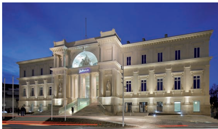
Nantes - Palais de Justice reconverti en un hôtel