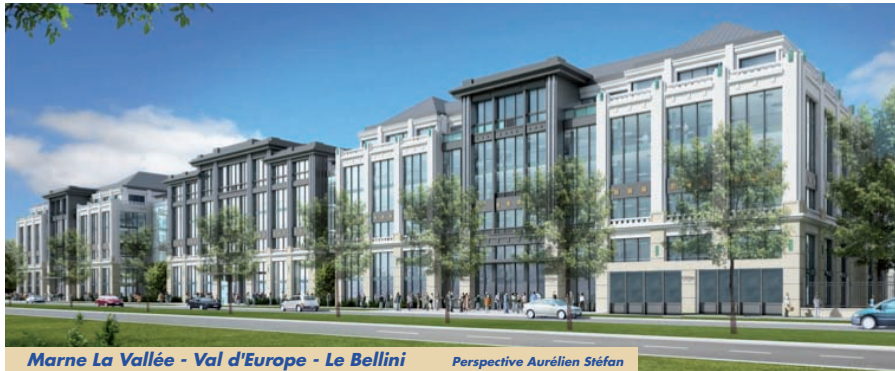
Marne La Vallée - Val d'Europe - Le Bellini Perspective Aurélien Stéfan