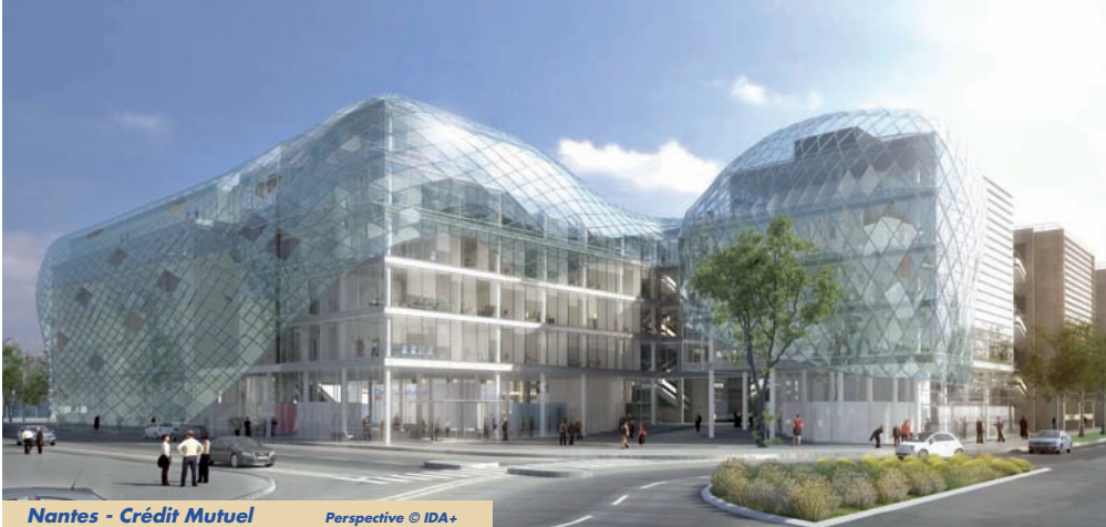
Nantes - Crédit Mutuel Perspective

Ainsi, la demande d'autorisation de travaux de l'Hôtel Colbert de Torcy rue de Vivienne a été obtenue en deux mois. Ce dialogue est précieux lorsque certains projets nécessitent des adaptations en cours de travaux, à l'instar du 16 Boulevard Montmartre où des détériorations seulement découvertes dans la phase de curage nous ont conduits à mettre au point, avec la DRAC et la Ville, une méthodologie de validation administrative des solutions proposées au fur et à mesure des travaux.