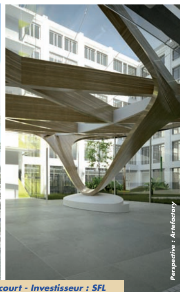
Perspective : Anifactory