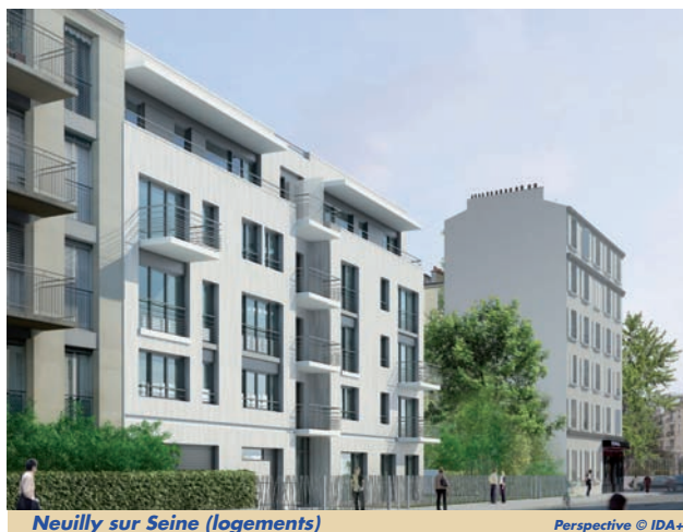
Neuilly sur Seine (logements)