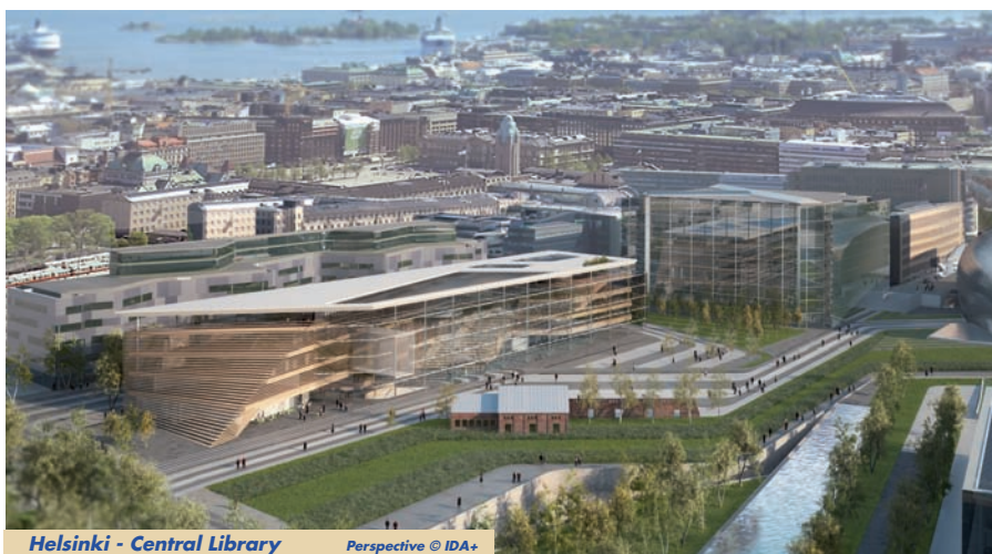
Helsinki - Central Library Perspective