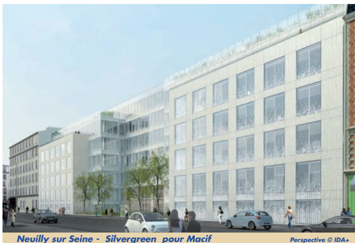
Neuilly sur Seine - Silvergreen pour Macif