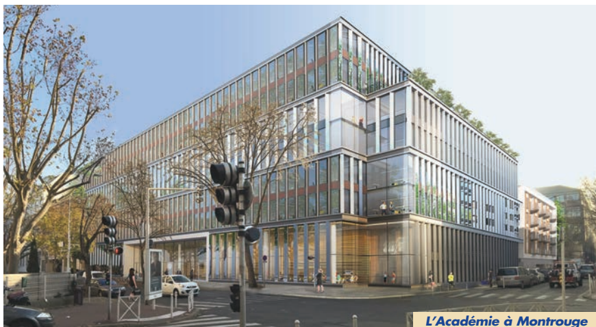
L'Académie à Montrouge