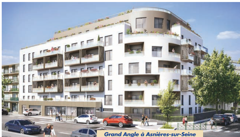
Grand Angle à Asnières-sur-Seine

haute tige et d'une végétation foisonnante. Conçue comme un village ponctué d'espaces de détente, de rencontres et d'échanges, extérieurs et intérieurs, comme des jardins partagés pour y cultiver son potager, un terrain de pétanque, une salle polyvalente susceptible d'accueillir des événements, une conciergerie, une loge et un logement gardien, des espaces de jeux pour les enfants... La résidence est entièrement close et sécurisée, organisée autour de promenades arborées. Afin de