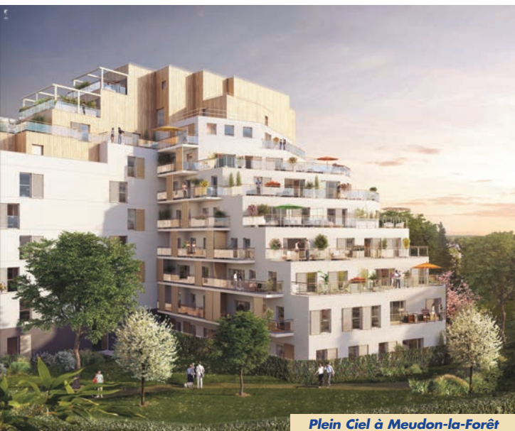
Plein Ciel à Meudon-la-Forêt