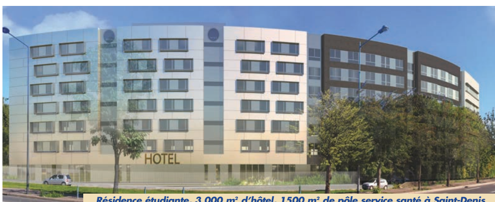
Résidence étudiante, 3 000 m 2 d'hôtel, 1500 m 2 de pôle service santé à Saint-Denis

A Meudon, « Plein Ciel », dont les travaux ont démarré en fin d'année 2017, rassemble 54 appartements du studio au 5 pièces avec terrasses, balcons, parc arboré et vues sur Paris.