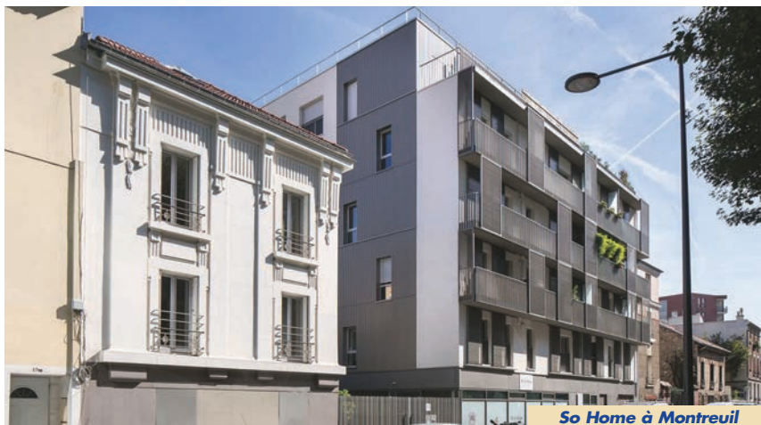
So Home à Montreuil

La résidence étudiante de 154 chambres a démarré à Saint-Denis. Elle a été vendue à Espacil Habitat. L'opération, multi-produits, regroupe également un hôtel de 3 000 m 2 loué à la chaîne B&B ainsi que 1 500 m 2 de pôle service santé.