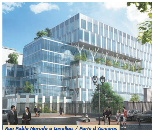
Rue Pablo Neruda à Levallois / Porte d'Asnières

des opérations en neuf ou en réhabilitation lourde, nous souhaitons aussi créer des produits sur mesure autour de besoins utilisateurs identifiés comme celui d'un pôle santé incluant laboratoires d'analyses, bureaux