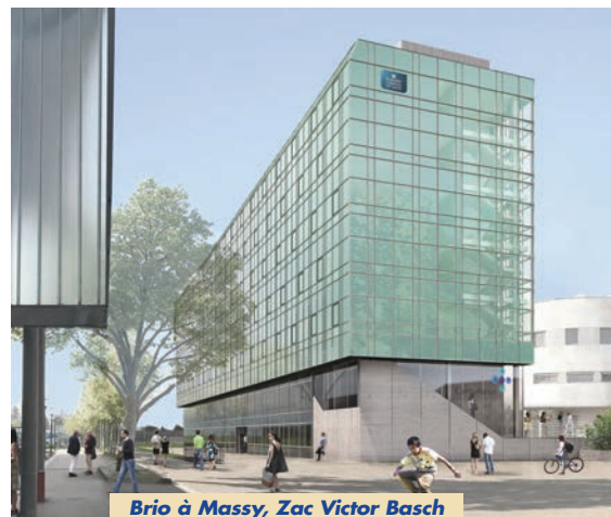
Brio à Massy, Zac Victor Basch

et de par la proposition architecturale qui marquera la requalification du secteur : élégance singulière du bâtiment, luminosité des espaces, confort, efficacité des plans de niveaux, souplesse d'utilisation et d'aménagement au service d'une fluidité relationnelle et de la performance collective, qualités environnementales... pour un lieu unique axé, selon les architectes, sur la qualité d'un vivre ensemble exemplaire au travail. Organisé autour d'un très large patio arboré, l'Académie développe ses bureaux caractérisés par une grande flexibilité, du rez-de-chaussée en double hauteur jusqu'au R+6.